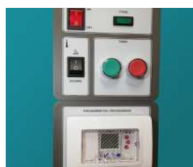
TABLEAU DE BORD ERGONOMIQUE

Tourelle d'extraction d'air intégrée sur le dessus de l'appareil