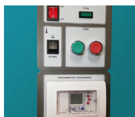
TABLEAU DE BORD ERGONOMIQUE

Tourelle d'extraction d'air intégrée sur le dessus de l'appareil